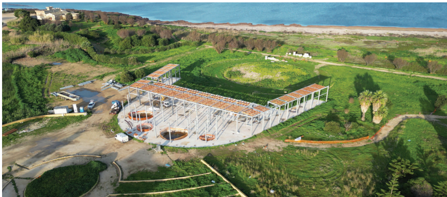
- Un parco naturale con spazi dedicati allo sport e alla cultura con un teatro di 800 posti a sedere, servizi di ristorazione, aree di sosta, sgambamento cani e area fitness.